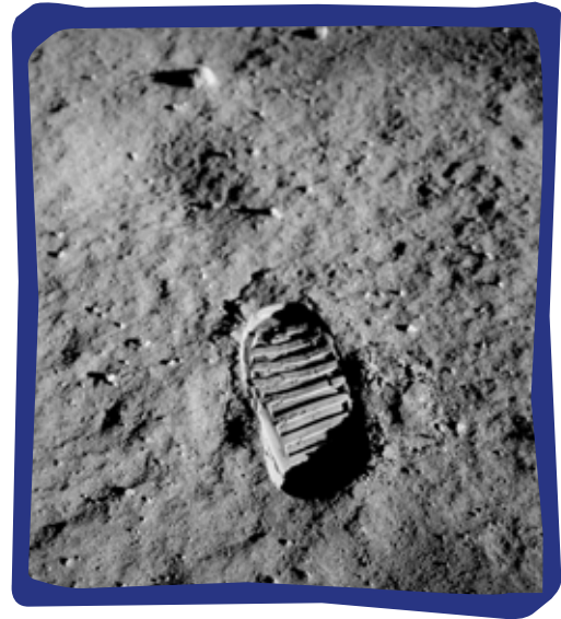
El primer pas de l'home fet a la lluna.

Quan les primeres persones humanes van arribar a la lluna, el 20 de juliol de 1969, deixaren com a símbol la petjada de la primera passa. I es va fer famosa aquesta frase de Armstrong: aquest és un petit pas per a un home, però un gran salt per a la humanitat .