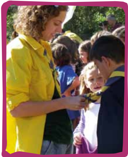
Imposició del fulard durant la festa del Pas a l'Agrupament Escolta i Guia La Claca de Cassà.