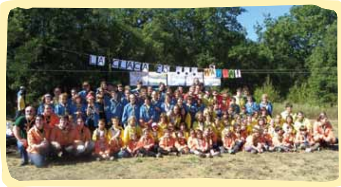
Agrupament Escolta i Guia La Claca de Cassà a l'acabar la festa

Alguns agrupaments aprofiten la celebració del Pas per donar els fulards als nous membres. Altres esperen que aquests facin la primera promesa. En el primer cas, aquests fulards han d'estar a punt, i es donen als nous membres un cop aquests, segons l'ordre de les unitats, han estat cridats.