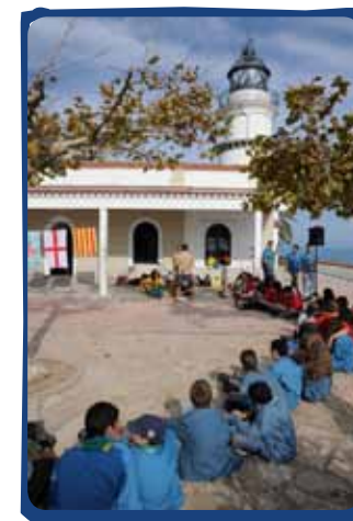
Festa del Pas celebrada al Far de Calella. Agrupament Escolta Montnegre