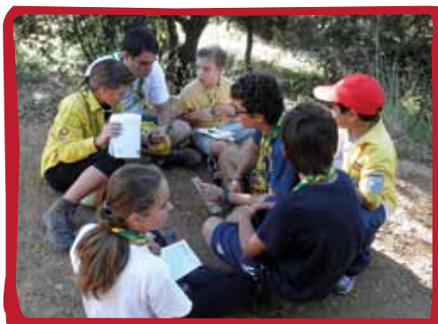
Llops i Daines de l'Agrupament Escolta Montnegre preparant els textos pel Pas.

Els membres que se'n van de la unitat pre-