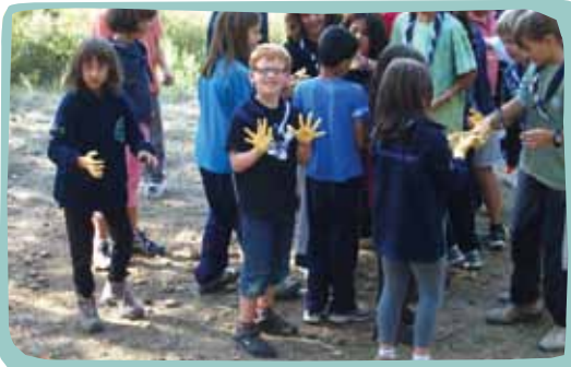
L'Agrupament Escolta i Guia Xiprers al Vent de Figueres en una activitat de l'eix d'animació dels colors.