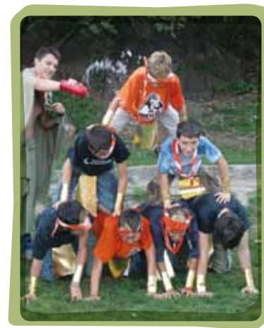
Agrupament Escolta i Guia Joan Pons, en un de les proves que realitzen abans de fer el pas de branca

intervenien les unitats, es llegeixen els petits testaments, es fan discursos, es passen les proves, es donen els obsequis, es donen les camises noves i s'imposa el fulard. Vegem quines són les diverses possibilitats que presenta aquest moment en la intervenció de les unitats i les diverses accions que poden fer.