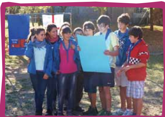
Agrupament Escolta i Guia Sant Narcís, de Girona, llegint un text durant la seva festa del Pas

El Pas quedarà materialitzat en aquesta celebració gràcies a les paraules que es diran en veu alta, als petits símbols que es donaran i també a les proves per demostrar l'esforç que cal fer per anar avançant en les etapes de la vida. És en l'apartat següent on exposem més detalladament aquests aspectes.