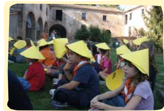
L'Agrupament Escolta i Guia Joan Pons en una activitat de l'eix d'animació de les cultures.