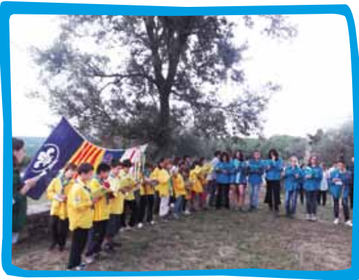
L'Agrupament Escolta i Guia Pla de l'Estany en un moment de la festa del Pas.