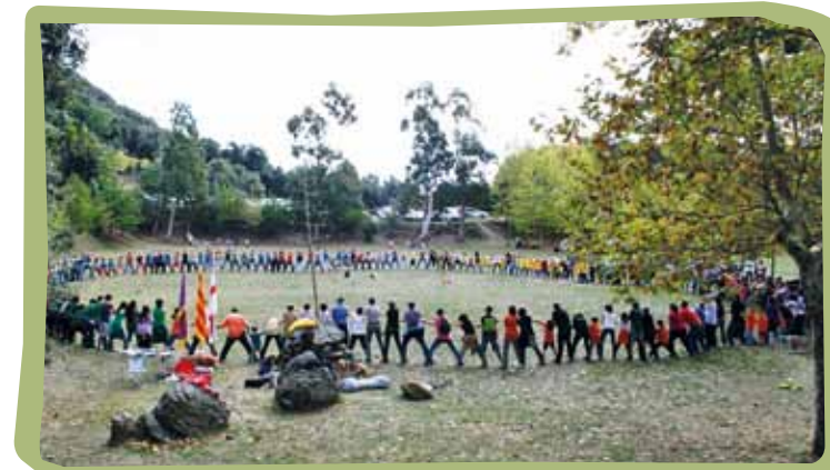
L'Agrupament Escolta i Guia Montpalau, celebrant la Festa del Pas a Hortsvinyà, octubre de 2011.

Quan l'any 1907 Baden Powell inicia el primer campament escolta a l'illa de Brownsea i, poc després, el 1908, publica el llibre "escoltisme per a nois", potser no es podia imaginar que amb poc temps les seves intuïcions arribarien a expandir-se internacionalment i transcendirien en la història. Ja han passat més de cent anys i aquell pensament inicial de BP és encara ben vigent. Creiem que, davant d'un món dominat per les noves tecnologies i el confort, podem afirmar com Baden Powell que un bon pas cap a la felicitat és fer-se sa i fort mentre sou nois, perquè pugueu ser útils i, per tant, gaudir de la vida quan sigueu homes! . Davant d'un món que canvia constantment, l'actitud escolta de ser capaç de fer les coses per un mateix esdevé una eina ben valuosa. Amb humilitat, Baden Powell tan sols pretengué suggerir-nos alguns camins , i és potser per això que l'escoltisme ha arribat a tants llocs, adaptant-se a realitats diferents.