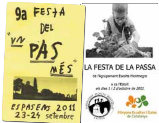
Exemple de portada dels fulletons per la festa del Pas.

Abans de començar la celebració, les unitats es reuneixen (sigui durant el primer dia de cau o durant la mateixa sortida del Pas). Es tracta de les unitats antigues, és a dir, amb tots els seus membres sense fer cap canvi. Si hi ha algun noi i alguna noia que són nous a l'Agrupament podran afegir-se a la seva nova unitat. Cal ser curós amb els membres que entren nous a l'Agrupament i explicar-los els detalls i el perquè de totes les coses noves que trobaran a l'escoltisme.