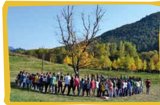
Agrupament Escolta i Guia Les Gavarres, de la Bisbal d'Empordà, durant la seva festa del Pas.

compte que som a començaments de curs i per això cal que el lloc no quedi massa lluny; aquest pot ser un símbol més del pas: comencem amb una petita sortida i deixem les grans per a final de curs. En tot cas, és bo que el lloc tingui una certa singularitat i que aportí significat a la festa.