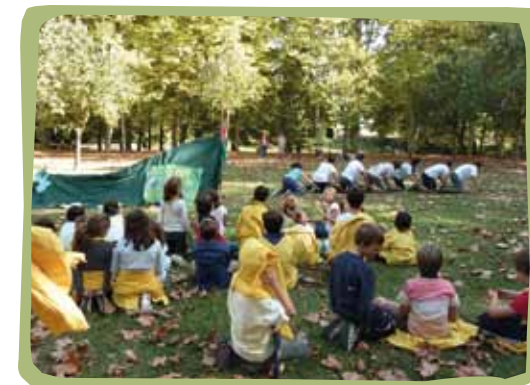
L'Agrupament Escolta i Guia Roca Guillera, de Santa Coloma de Farners, en una activitat de l'eix d'animació de la papallona.